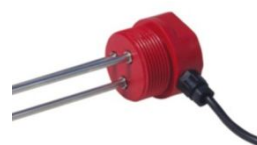
Vand på gulv